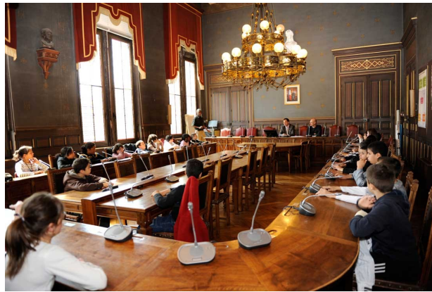
Les élèves dans la salle du conseil municipal de Valence